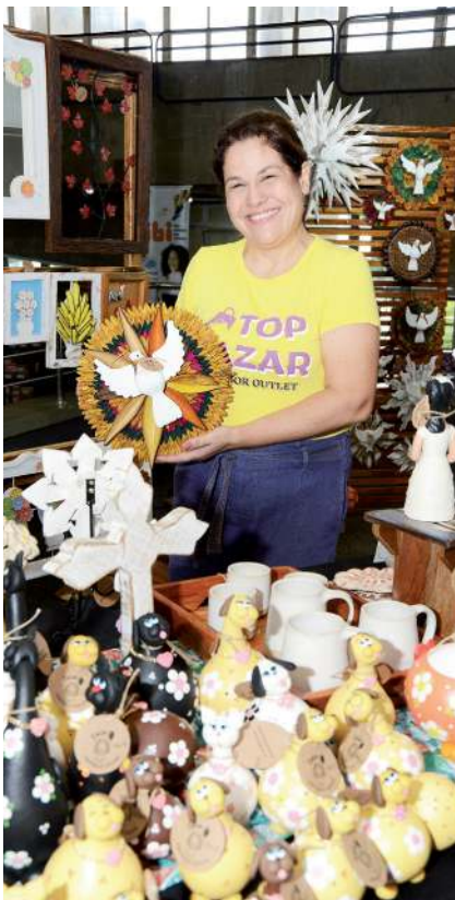
@emporiodecorluisa 18 99134 7129