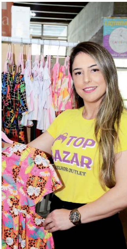
@villamajukids 18 99712 3204