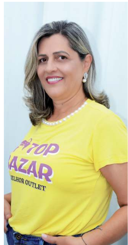
@ribelatooficial 18 99640 6235