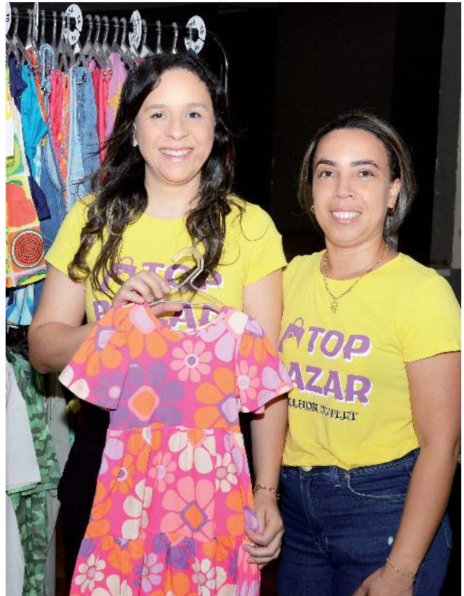
@arcoiriskidseteens 18 99151 7777