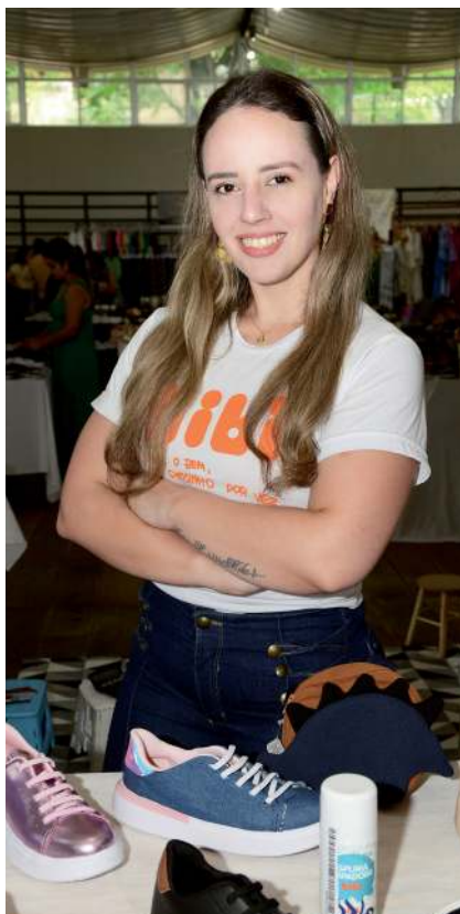
@bibiprudenshopping 18 99630 9292