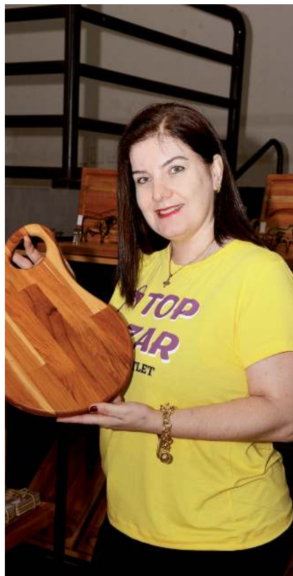
@studiololapp 18 99757 6707