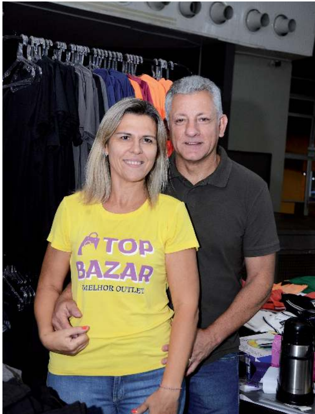
@_basicstoremultimarcas.pp 18 99765 8080